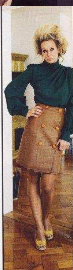
Oben: Seidenbluse und Rock, Alessandro dell'Acqua; Highheels, Lanvin. Mitte: Nur eine kleine Auswahl aus der umfangreichen Highheel-Kollektion der PR-Frau. Unten: Ausgefällene Düfte und extravagante Nagellacke.

Tanzbar Paradiso , Rumfordstrasse 2, München, Tel. +49 177 7290928, www.paradiso-tanzbar.de