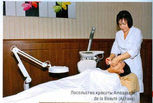
Посольство красоты Ambassade de la Beauté (Астана)