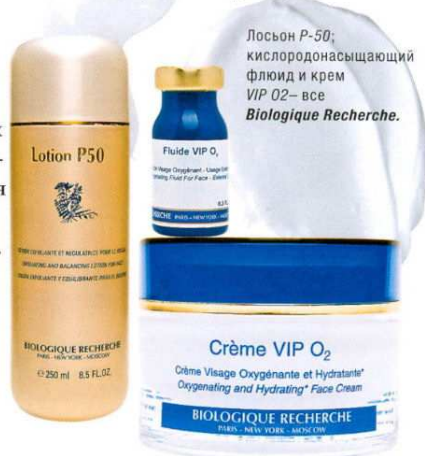
Лосьон P-50; кислородонасыщающий флюид и крем VIP O2 – все Biologique Recherche.

Препараты Biologique Recherche замечательны тем, что, презрев пассивную поставку питательных веществ, они берут под контроль все этапы функционирования кожи, регулируя, подстегивая, а порой и «перезапуская» эти процессы. Зрелую же кожу они заставляют работать в «молодом» режиме. Такое «принудительное» лечение вкупе с воздействием специально созданного для Biologique Recherche аппарата Remodeling Face дает