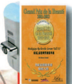
榮獲 2011-12 年度香港美容權威大獎之專家送禮精華

以高端醫學為背景，強調高濃度的活性療效，發揮個性化設計，滿足最挑剔、要求最高的精英貴族